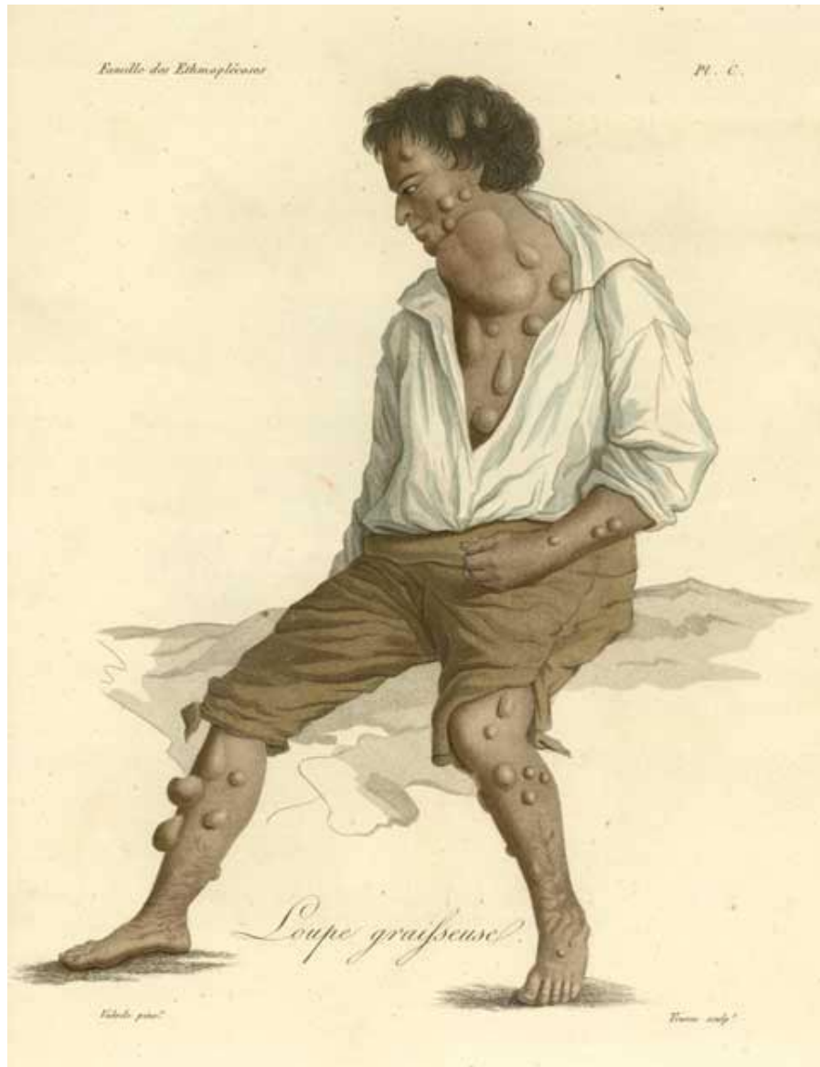
“Loupe graisseuse”. Lámina de Nosologie naturelle, ou les Maladies du corps humain distribuées par familles , Paris, Caille et Ravier, 1817. Biblioteca Vicente Peset. Instituto de Historia de la Medicina y la Ciencia (Universitat de València - CSIC).