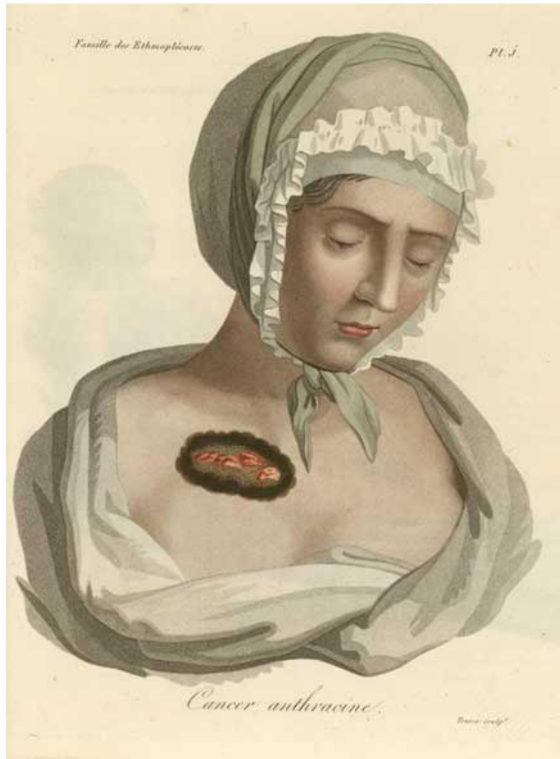
“Cancer Anthracine”. Lámina de Nosologie naturelle, ou les Maladies du corps humain distribuées par familles , Paris, Caille et Ravier, 1817.