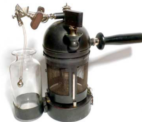
Pulverizador de Championnière