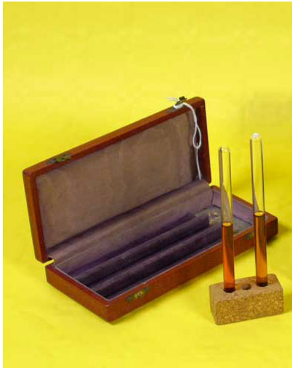
Hemoglobinómetro de Gowers

El estilo de escritura de Gowers era claro y conciso; trató de emplear una terminología exacta y no solía alejarse de la descripción, es decir, no era amigo de formular teorías. En su Diagnosis of Diseases of Spinal cord (1880) describió la existencia del tracto que lleva su nombre y también introdujo los términos “miotáctico” y “reflejo patelar”, entre otros. Es un texto que muestra la relación armoniosa entre la anatomía, la fisiología y la clínica. En 1881 publicó The borderland of epilepsy . Este libro contiene la primera descripción de la naturaleza tetánica de las convulsiones epilépticas así como del ‘intervalo de silencio’. También jugó un papel de transición entre los puntos de vista sobre la epilepsia del siglo XIX y las nuevas ideas sobre la enfermedad aportadas por su maestro Jackson.